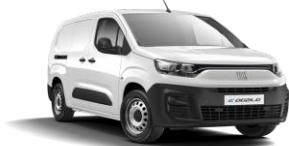
Ice White (549) (perusväri)