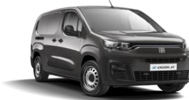
Platinum Grey (691) (metalliväri)