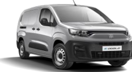
Artense Grey (113) (metalliväri)