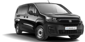
Metallic Black (632) (metalliväri)