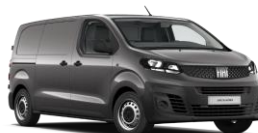
Platinum Grey (691) (metalliväri)