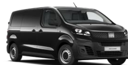
Metallic Black (632) (metalliväri)