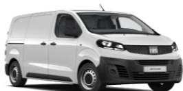
Ice White (549) (perusväri)