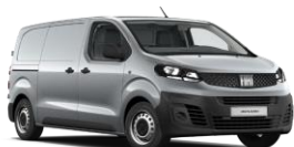
Artense Grey (113) (metalliväri)