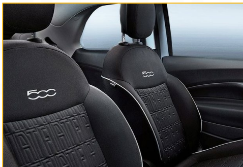
Istuimien tumma kangasverhoilu | 573, 574, 575