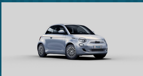
Celestial Blue | 278