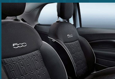
Istuimien tumma kangasverhoilu | 573, 574, 575