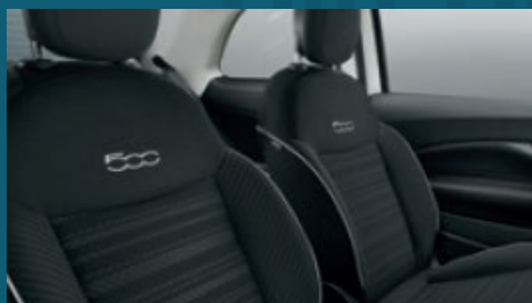
Istuimien tumma kangasverhoilu | 702