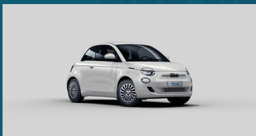
Ice White | 268