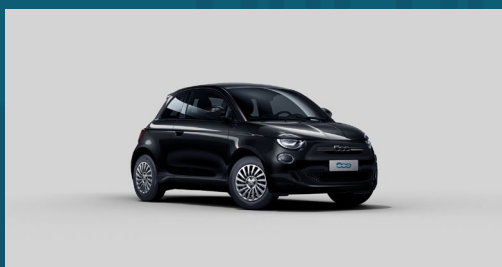
Onyx Black | 601