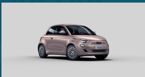
Rose Gold | 237