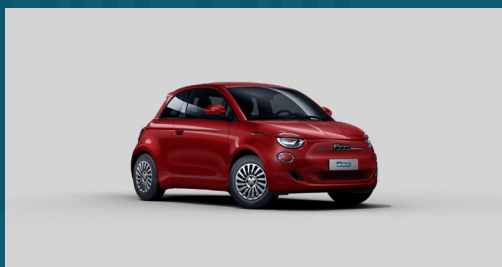
Passione Red | 111